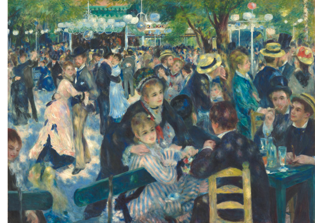
Pierre Auguste Renoir Tanz im Moulin de la Galette, 1876 Musée d'Orsay, Paris, legs Gustave Caillebotte, 1894