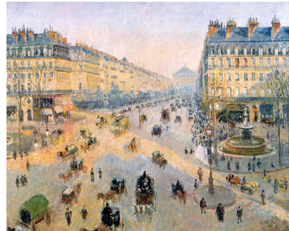
Camille Pissarro Die Avenue de l'Opéra an einem sonnigen Wintervormittag, 1898 Musée des Beaux-Arts de la Ville de Reims

Die Impressionisten und ihre Zeitgenossen haben die Verwandlung der Stadt beobachtet und – Nähe und Distanz, Vertrautheit und Entfremdung, Bewegung und Zerstreuung auslotend – in ihren Gemälden formuliert. Der Blick von oben auf die Menschenmenge und den Verkehr in den belebten Boulevards oder auf menschenleere Plätze, Geselligkeit und Einsamkeit, der flüchtige Augenblick auf der Straße, im Café oder in den Parkanlagen sind Bildformen, die die Impressionisten erst in der Auseinandersetzung mit der neuen Metropole entwickelten.