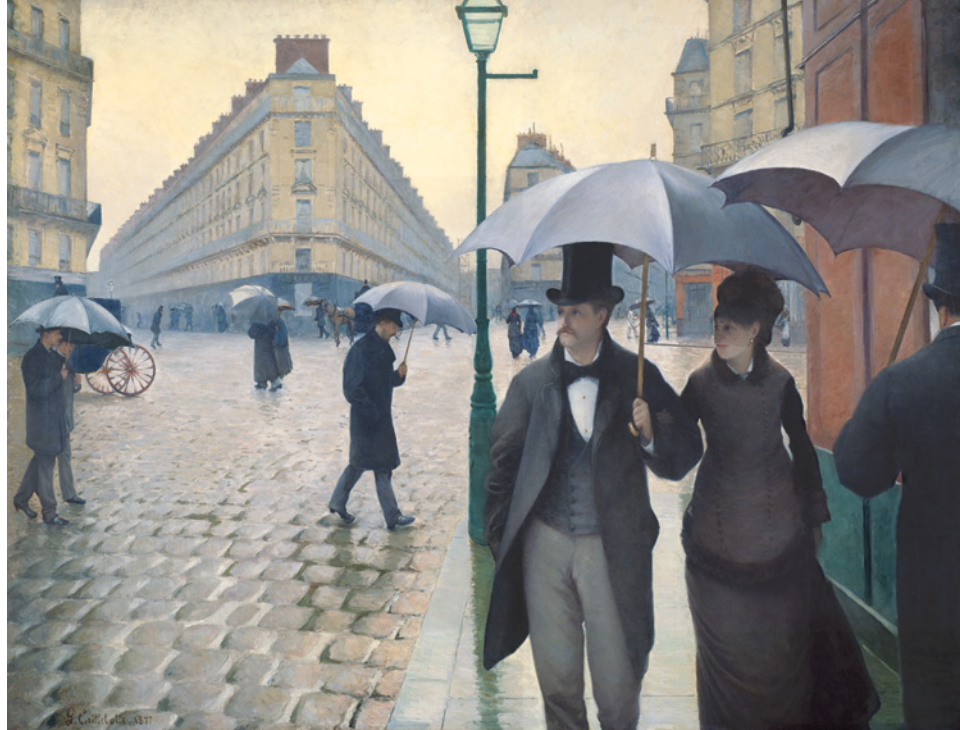
Gustave Caillebotte Straße in Paris, an einem Regentag, 1877 The Art Institute of Chicago, Charles H. and Mary F. S. Worcester Collection

Beispielhaft für diese Entwicklung ist der spektakuläre, 1868 eingeweihte Pont de l'Europe über den Gleisen der Gare Saint-Lazare.