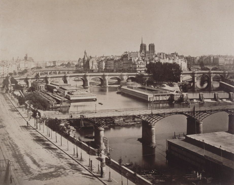
Gustave Le Gray Blick auf Paris mit dem Pont des Arts und dem Pont-Neuf, um 1859 Musée d'Orsay, Paris

Die Ausstellung erschließt die Hauptstadt der Moderne in mehreren Kapiteln: Sie beginnt mit dem Panorama-Blick vom Montmartre, zeigt Boulevards und Straßen, Plätze und Monumente, Parks und Cafés, den Blick aus Wohnungen und Ateliers. Sie lässt die Besucherin und den Besucher wie einen Flaneur entlang den Quais schlendern, den Blick durch die Bahnhöfe streifen und die Vororte erkunden, um – ins pulsierende Großstadtleben zurückgekehrt – die Vergnügungsorte und Restaurants, Theater, Oper und Zirkus bei Nacht aufzusuchen.