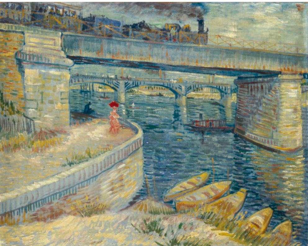
Vincent van Gogh Die Seine-Brücken von Asnières, 1887 Stiftung Sammlung E.G. Bührle, Zürich

Um den Bahnhof und die Brücke entstand ein neues Stadtviertel mit weitläufigen Straßen und großen Häuserzeilen. In unmittelbarer Nähe wurden neue Boulevards angelegt, die den Bahnhof und die Vorstädte mit der Innenstadt verbanden, eingefasst von einer standardisierten Bebauung mit einheitlicher Fassadengestaltung und breiten Trottoirs mit Baumreihen, Litfasssäulen, Gaslaternen, Läden, Kaufhäusern, Passagen und Cafés.