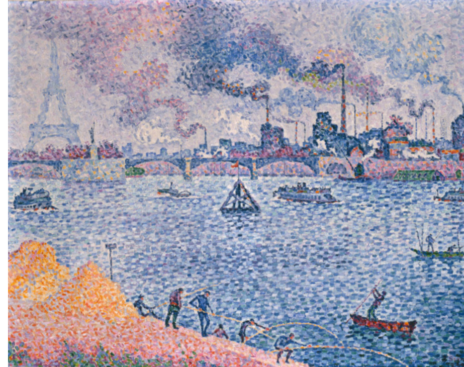
Paul Signac Der Pont de Grenelle, 1899 Amos Anderson Art Museum, Collection Sigurd Frosterus