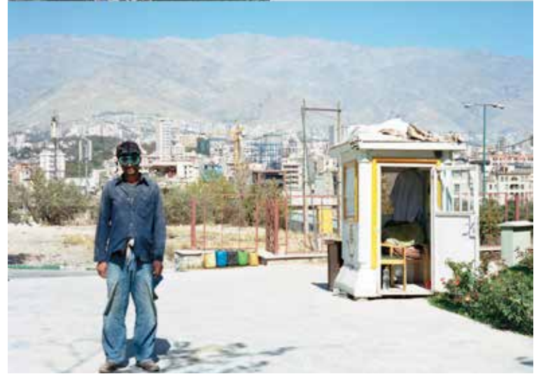
↑ Hannah Darabi, Enghelab Street, A Revolution through Books, Iran 1979 – 1983 , 2019, Künstlerbuch, 33,5x24 cm, © Hannah Darabi