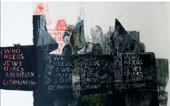
Nancy Spero, Who needs , 1990, © VG Bild-Kunst, Bonn 2019 / The Nancy Spero and Leon Golub Foundation for the Arts, Courtesy Galerie Barbara Gross, München

Teilnahmebeitrag 10 € / 5 €. Anmeldung im Besucherbüro erforderlich.