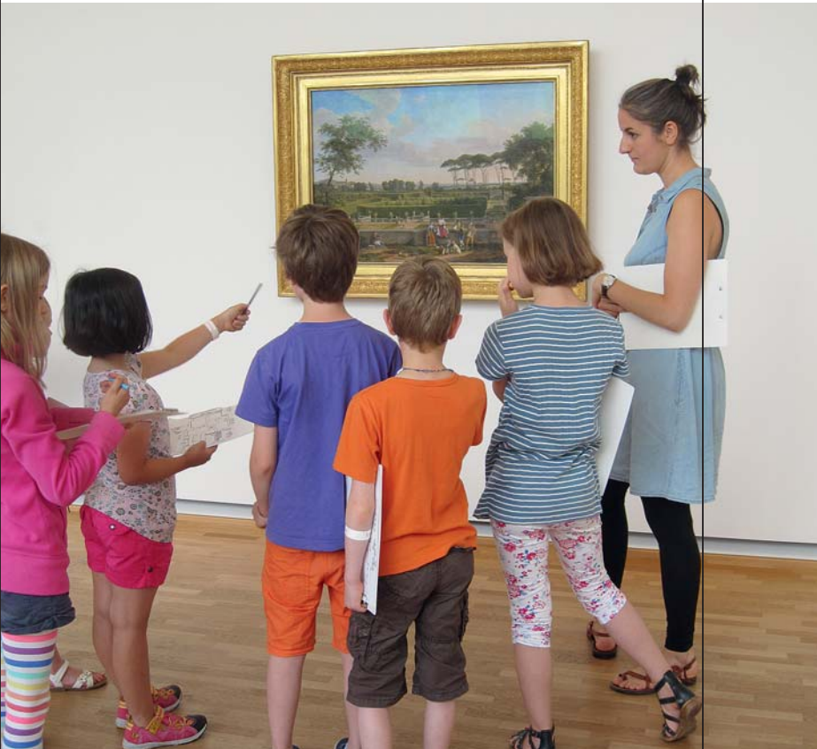
Alles neu macht der Mai: Am 19.5. ist Sparda-Familientag im Museum Folkwang. Natürlich kostenfrei!