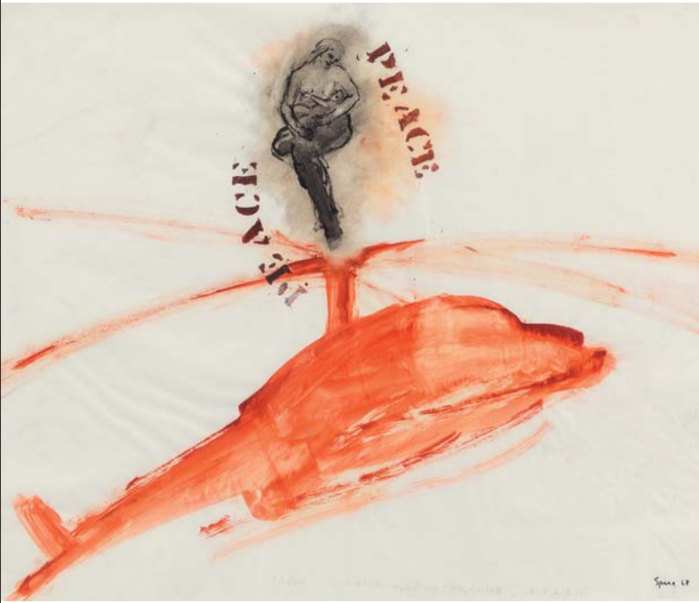
Nancy Spero, P.E.A.C.E., Helicopter, Mother + Children, 1968