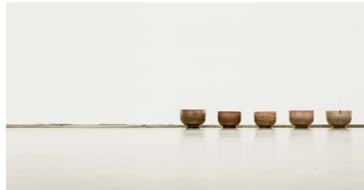
Young-Jae Lee, Ohne Titel , 2006–2018, 5 Keramiken aus der Serie der Spinatschalen