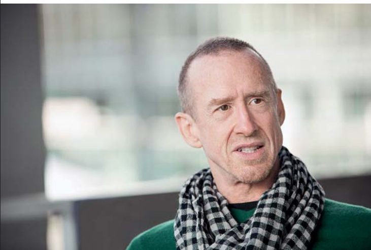
Porträt William Forsythe

Begrenzte Teilnehmerzahl. Karten am Tag der Veranstaltung an der Kasse erhältlich.