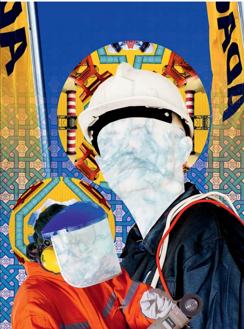
Jorieke Tenbergen, Saints of Steel , © Jorieke Tenbergen 2017