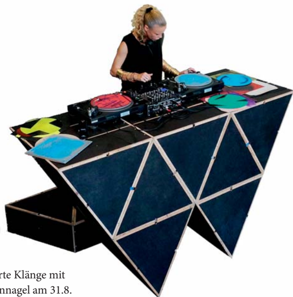
Unerhörte Klänge mit Julia Bünnagel am 31.8.

Anmeldung im Besucherbüro erforderlich: info@museum-folkwang.essen.de . Begrenzte Teilnehmerzahl. Teilnahmegebühr 20 €, Mitglieder des Kunstring Folkwang 10 €.