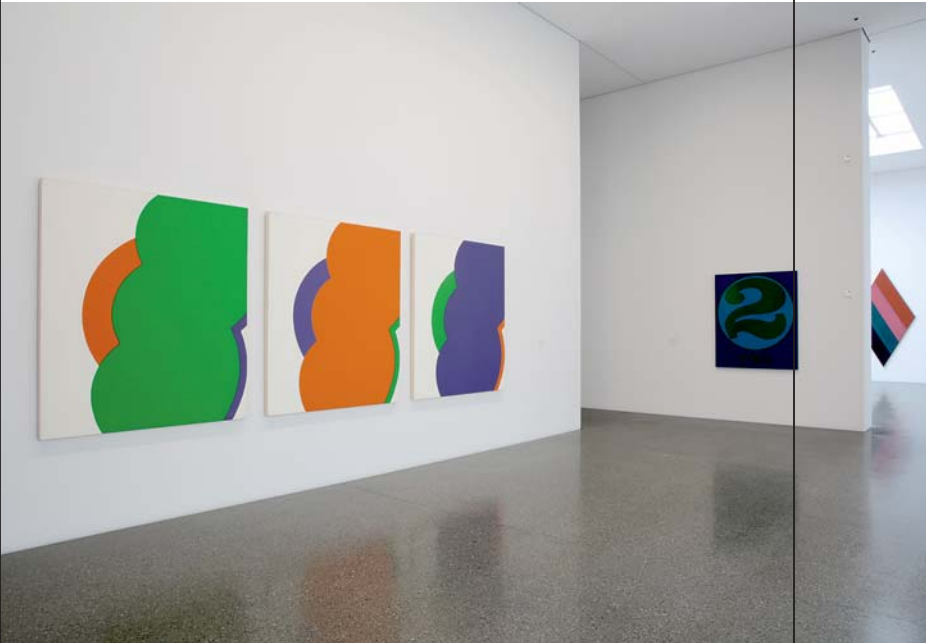
Pop Art und Co.: Facetten der 1960er Jahre in der Sammlung