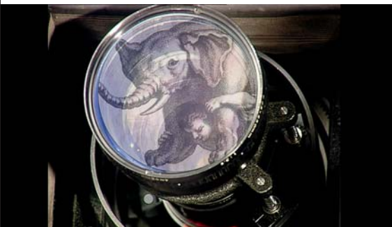
Alexander Kluge, Minutenfilme , 2016, Film still