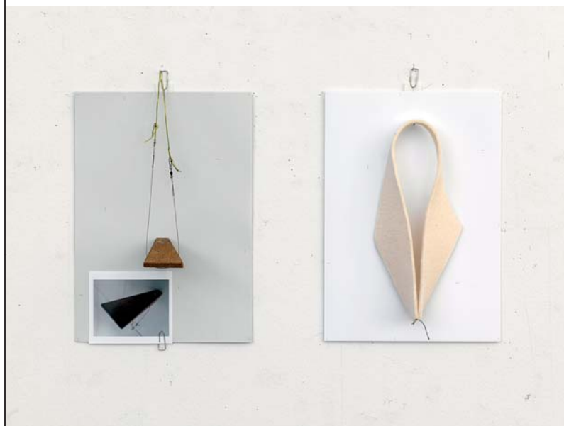
Catharina van Eetvelde, ilk<egg_contrapunctus>_15.83 , 2016 © Catharina van Eetvelde / VG Bild-Kunst Bonn, 2016