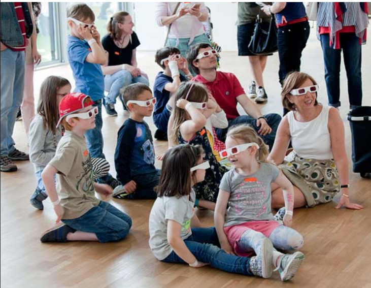
Farben sehen: In der Sammlung und bei Gerhard Richter

Teilnahmebeitrag: 3 € / 1,50 € / Kunstring Folkwang frei. Begrenzte Teilnehmerzahl.