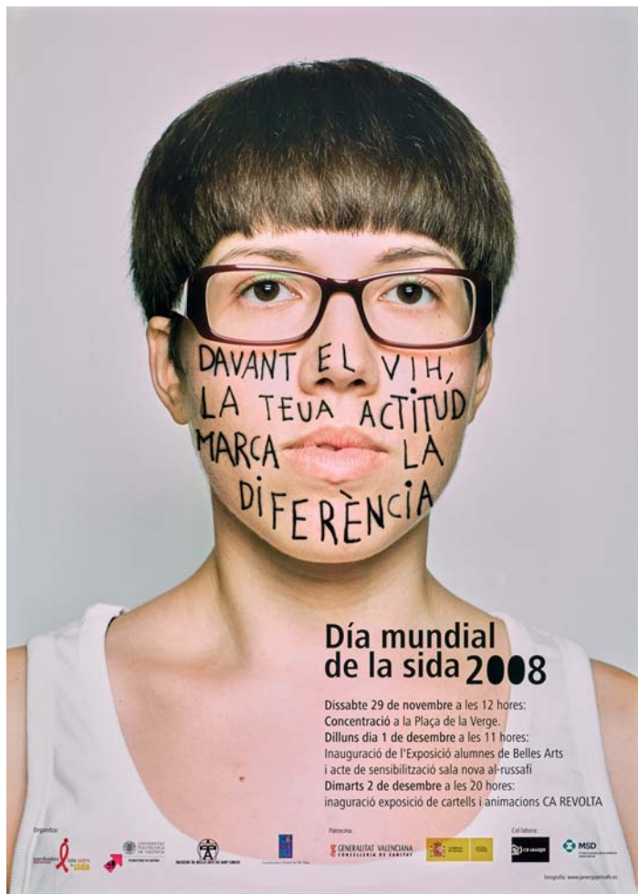
Anonym, Foto: Javier Gayetvalls Dia mundial de la sida 2008