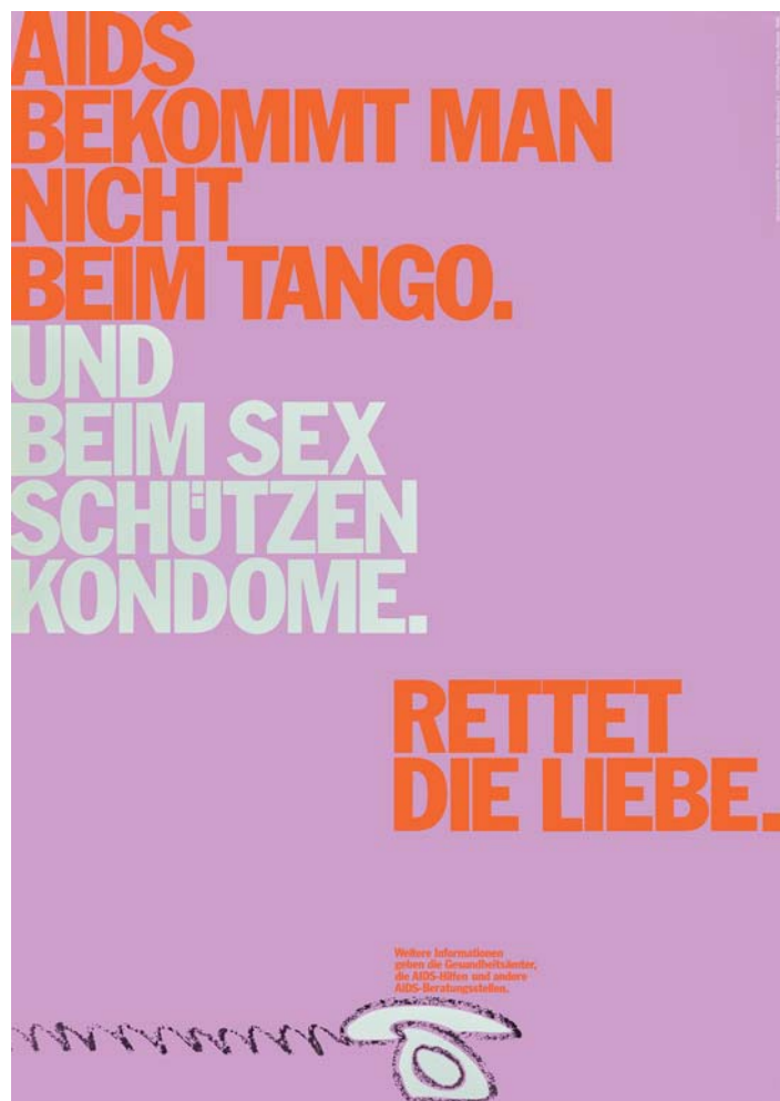
Papen Hansen, Rettet die Liebe . AIDS bekommt man nicht beim Tango. Und beim Sex schützen Kondome, ca. 1995