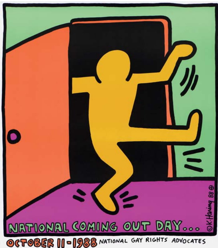
Keith Haring, National Coming Out Day , 1988 Sammlung Noirmontartproduction, Paris © Keith Haring Foundation