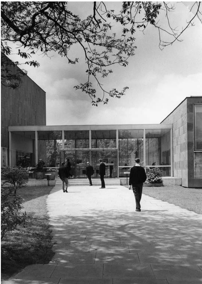
Museum Folkwang, Neubau, Blick auf den Besuchereingang, ca. 1965, (Architekten: Werner Kreutzberger, Erich Hösterey und Horst Loy)

offen, an die Künstler*innen anknüpfen können. In diesem Symposium werden von Künstler*innen, Kurator*innen, Publizist*innen und Forscher*innen Strategien und Orte der Präsentation vorgestellt, bei denen transkulturelle und vernetzte Arbeitsweisen im Mittelpunkt stehen. Zentrale Fragen des Symposiums sind: Wie kann Fotografie Einblicke in diverse Vorstellungen von Kultur und Gesellschaft geben? Wer spricht über welche Themen? Wie können Ausstellungen und Publikationsformen globale Perspektiven aufzeigen? Welche Formen der Übersetzung sind zu leisten und entsteht dabei ein produktiver Widerstand? Welche Grenzen hat der vielstimmige und vernetzte Austausch?