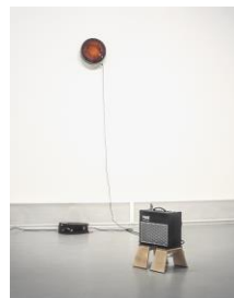
Saâdane Afif Blue Time (Sunburst) , 2004 Holz, Lack, Verstärker, Mikrofon, Kabel Ø 35 mm © Saâdane Afif