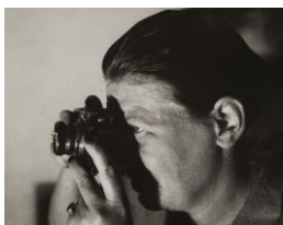
Autor:in unbekannt Germaine Krull mit Contax um 1932 Silbergelatineabzug, 11,5 x 14,5 cm © Nachlass Germaine Krull, Museum Folkwang, Essen